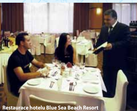
Restaurace hotelu Blue Sea Beach Resort

3 hlavní výhody hotelu: ideální poloha, vodní park v blízkosti, pěkná pláž.