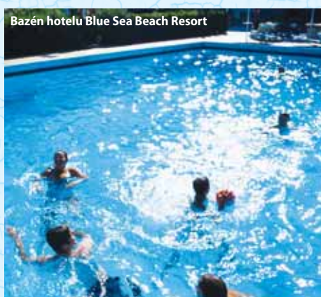
Bazén hotelu Blue Sea Beach Resort